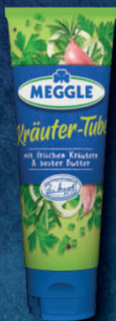
Kräuter-Tube 80 ml