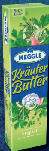
Kräuter-Butter 5 x 20 g