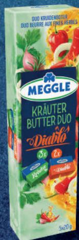
Kräuter-Butter Duo Diablo 5 x 20 g (3 x Kräuter, 2 x Diablo)