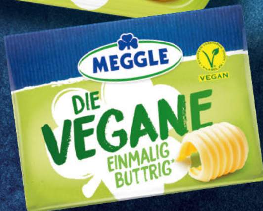
Die Vegane 250 g