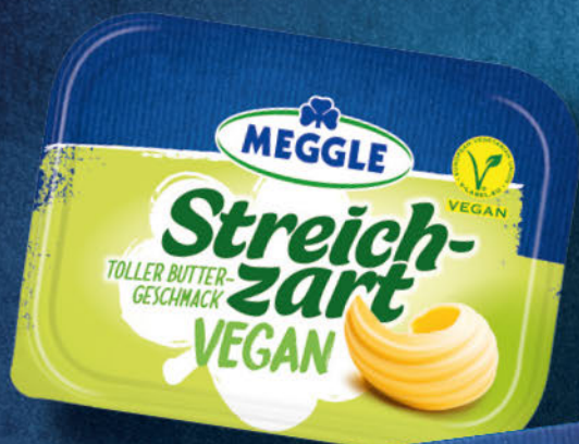
Streichzart vegan 250 g