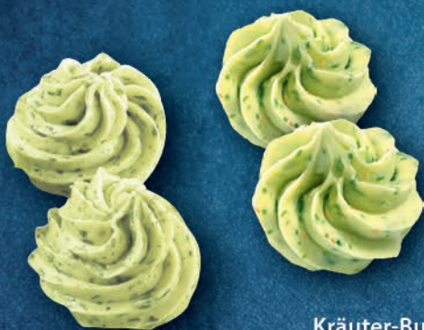
Kräuter-Butter Rosetten mit Knoblauch 10 g